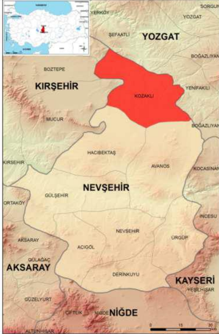
Şekil- 3: Kozaklı İlçesi Lokasyon Haritası 14

Kozaklı kaplıcaları Alman Kaplıcaları Birliği sınıflamasına göre Sodyum'lu, Kalsiyum'lu ve Klor'lu olup A ve C grubu şifalı sular grubuna girmektedir. Su sıcaklığı 27°C ve 93°C arasında değişmektedir. Sağlık turizminde önemli bir yere sahip kaplıcalar ve içmeceler Kozaklı ilçesinde son yıllarda yapılan yatırımlarla kendini hissettirir duruma gelmiştir. Türkiye'nin en önemli Termal Sağlık merkezlerinden biri olan Nevşehir'in Kozaklı İlçesi'ndeki Turistik Konaklama Tesislerinde sağlık turizmine yönelik faaliyet içeren 20 adet otel ve motel, 7.700 yatak kapasitesi ile hizmet vermektedir. Özel hizmet veren kaplıcaların yanı sıra Kozaklı belediyesine ait kaplıcalar da bulunmaktadır. Bu sayede her bütçeye uygun