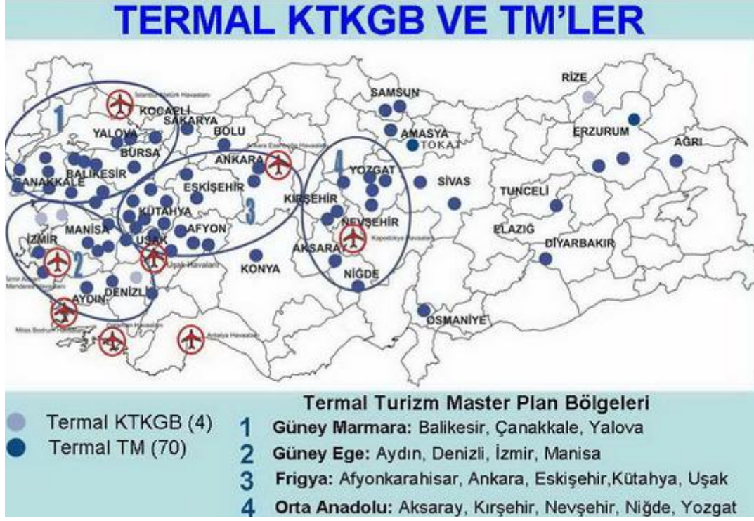
Şekil- 2: Termal Turizm Master Bölgeleri

Bu alanlar; Güney Marmara Termal Turizm Bölgesi (Çanakkale, Balıkesir, Yalova), Frigya Termal Turizm Bölgesi (Afonkarahisar, Kütahya, Uşak, Eskişehir, Ankara), Güney Ege Termal Turizm Bölgesi (İzmir, Manisa, Aydın, Denizli) ve Orta Anadolu Termal Turizm Bölgesi (Yozgat, Kırşehir, Nevşehir, Niğde) şeklindedir. Bu bölgelerin her birinin destinasyon merkezi olarak geliştirilmesi ve bu bölgeler içinde termal kaynaklı tesisler başta olmak üzere golf, doğa turizmi, su sporları vb. turizm türleri ile bütünleşmesi ve yakın çevredeki diğer kültürel ve doğal değerlerle de ilişkilendirilmesi hedeflenmektedir.